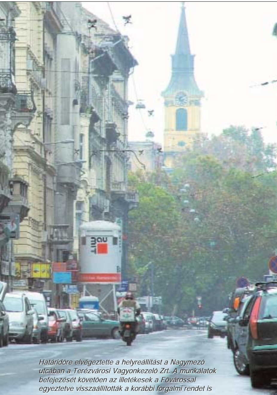
Határidőre elvégeztette a helyreállítást a Nagymező utcában a Terézvárosi Vagyonkezelő Zrt. A munkálatok befejezését követően az illetékesek a Fővárossal egyeztetve visszaállították a korábbi forgalmi rendet is