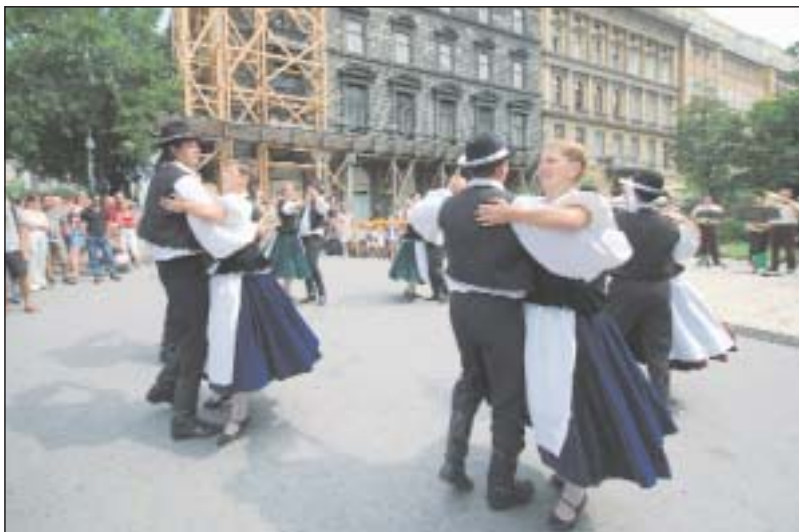
Augusztus 20-án az Ady-szobor szomszédságában táncokkal és énekkel köszöntötték államalapításunk ünnepét. A több száz fős közönséget vonzó programot a TERMA támogatásával a Terézvárosi Német Kisebbségi Önkormányzat szervezte

Jelentkezni a formanyomtatvány kitöltésével személyesen, faxon vagy e-mailben lehet. A jelentkezési lapokat a polgármesteri hivatal ügyfélszolgálatán és recepciószolgálatán vehetik át az érdeklődők, vagy letölthetik a honlapunkról ( www.terezvaros.hu ). A csoportokba a jelentkezés sorrendjében lehet bekerülni. Jelentkezési határidő: 2007. szeptember 3-25. között. A kitöltött, aláírt jelentkezési lapokat a következő címre kérjük beküldeni: Polgármesteri Kabinet, 1067 Budapest, Eötvös u. 3. Fax: 342-7582, Tel.: 342-0909/2210. E-mail: biro.ferenc@terezvaros.hu . További információ: www.terezvaros.hu