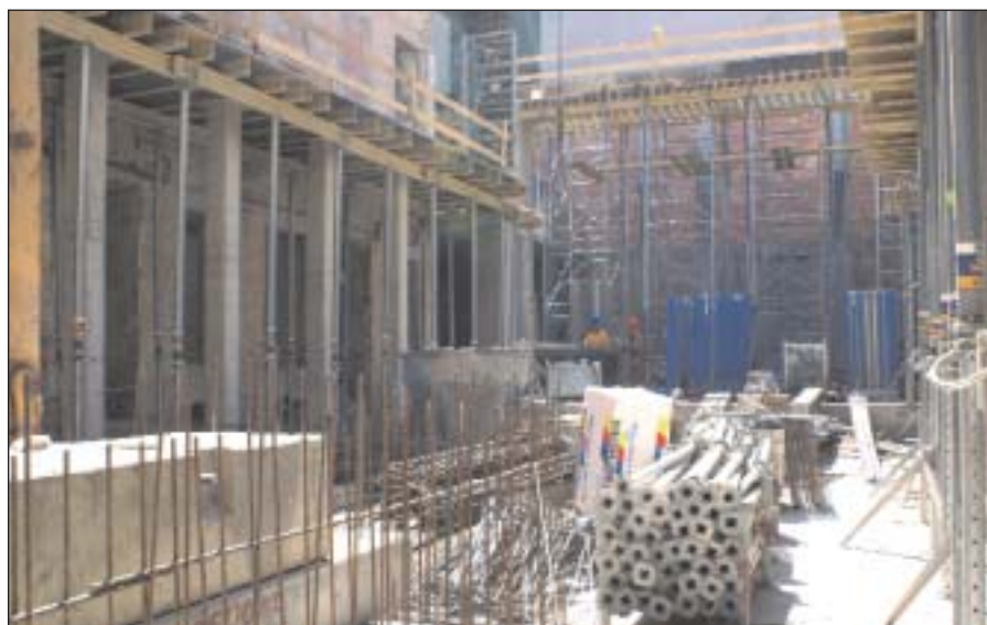
Vasbetonszerelés a leendő nézőtérén