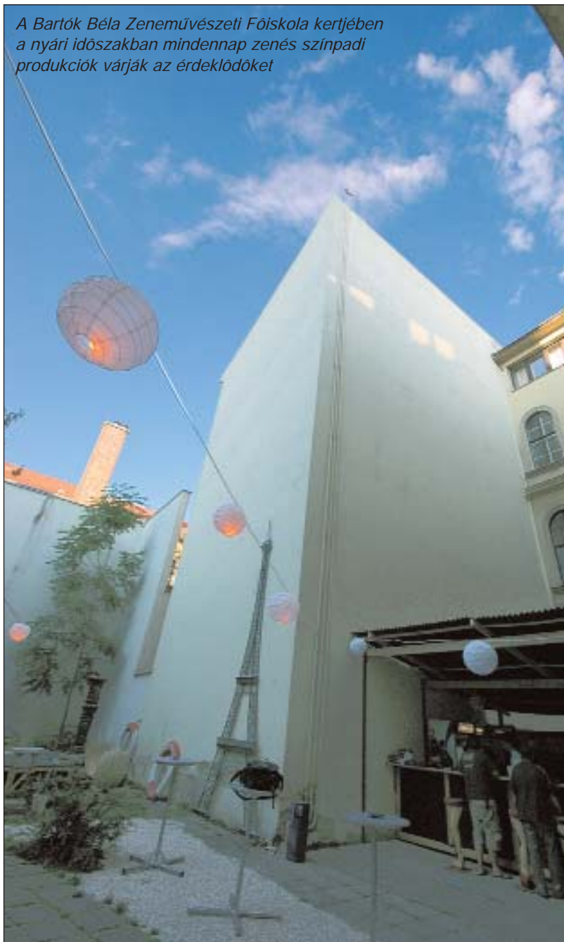
A Bartók Béla Zeneművészeti Főiskola kertjében a nyári időszakban mindennap zenés színpadi produkciók várják az érdeklődőket