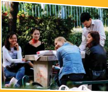
Tanóra a Károlyi kertben