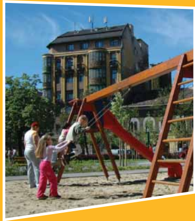
Megújult a Mátyás tér is