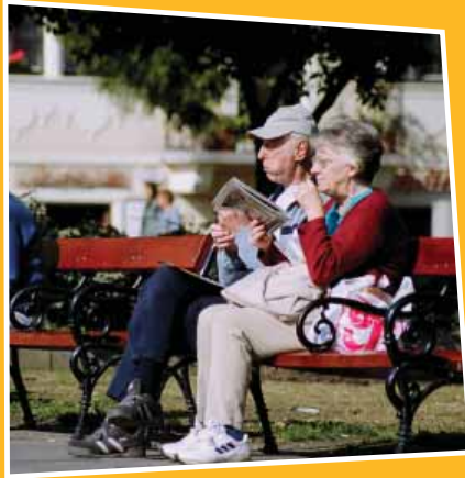
Pihenés a Szabadság téren

További információ: 06 80 201 138 -as zöld számon 12-16 óra között, és a 06 20 941 5772 -as mobil telefonszámon